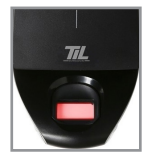
Disponible avec capteur biométrique